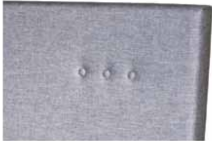
1C. Hoofdbord Montreal Een modern 'classic' model met 2x drie knopen aan beide kanten. - Buitenmaat: H110, D15, br +20cm