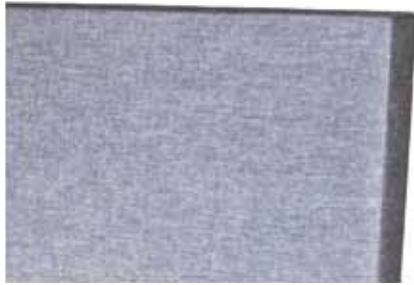
1A. Hoofdbord Luxe Een robuust en strak ontwerp, de voorzijde is aangenaam zacht. - Buitenmaat: H110, D13, br +20cm

De Swiss Beds producten staan bekend om zijn betrouwbaarheid en geven u vele jaren een goede nachtrust en ontspanning.