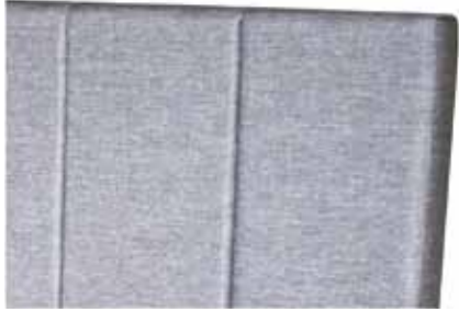
1B. Hoofdbord Geneve Elegant ontwerp met zes verticale banen. - Buitenmaat: H110. D15. br +20cm